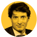
Armand du Chayla Brittany Ferries