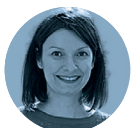
Flora Camp PwC