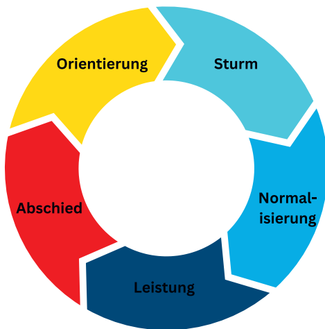
Abbildung 1 Phasenmodell nach TUCKMAN 12 (Eigene Darstellung)

Kommen meist aus der Arbeiterklasse oder unterem Bürgertum, oftmals Selbstaufsteiger, die es nicht leicht im Leben hatten und daher die Probleme der unterdrückten Klasse kennen. (Proletariat und Kleinbürgertum)