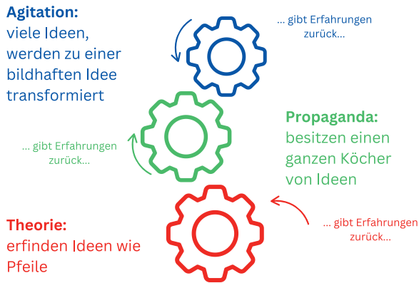
Abbildung 2 Drei Typen einer Bewegung und ihre Wirkrichtung (Angelehnt an Plechanow 13 , eigene Darstellung)