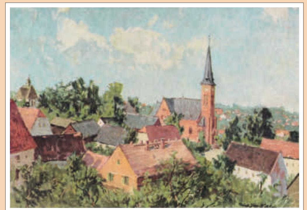
Zeichnung von Rudolf Pilz