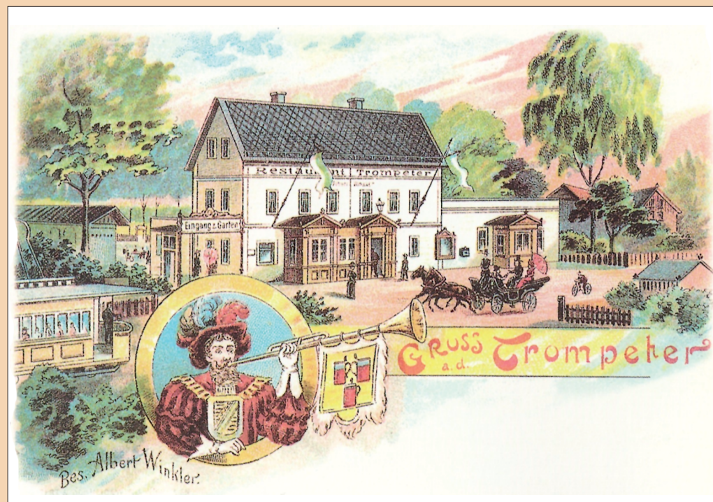
Postkarte vom Restaurant „Trompeter“