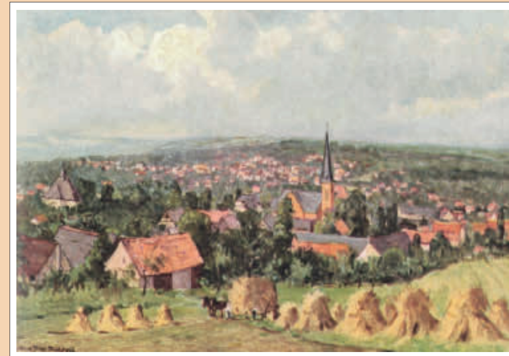
Blick vom Taubenberg