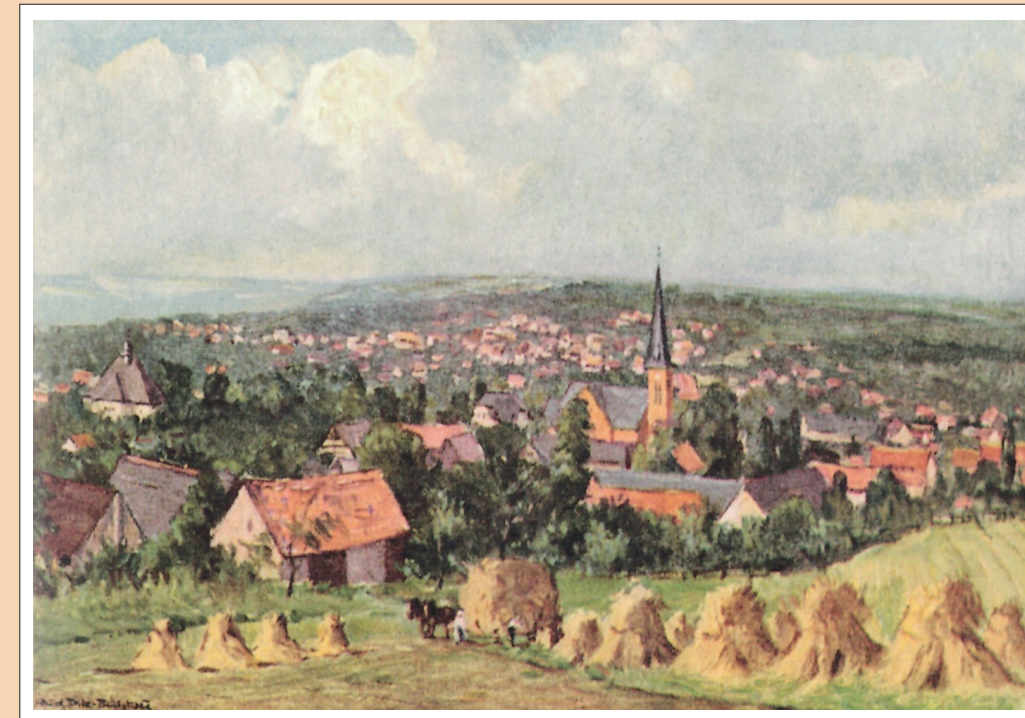
Blick vom Taubenberg