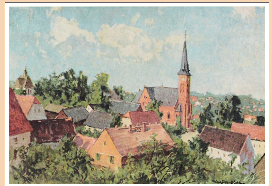
Zeichnung von Rudolf Pilz